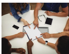
La structure sollicitée pour recevoir, conseiller le conjoint(e)